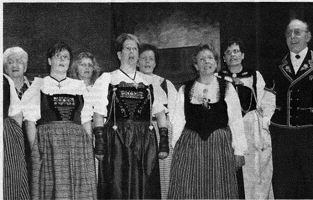
Die Sangerinnen und Sanger des Berner Trachtenchors sangen aus vollen Kehlen.